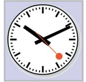
Main-Weser-Bahn im Takt