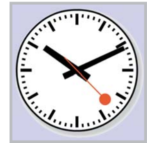
Main-Weser-Bahn im Takt